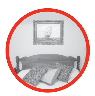
កុំដាក់កញ្ចក់រូបថត និង កញ្ចក់ឆ្នះ មុខ នៅលើក្បាលដំណេកឲ្យសោះ។